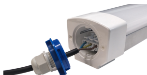
Système de montage et branchement rapide